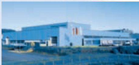
Hirschvogel Aluminium GmbH, Marksuhl

Tel.: 08243 291-5539 Fax: 08243 991-042 recruiting@hirschvogel.de