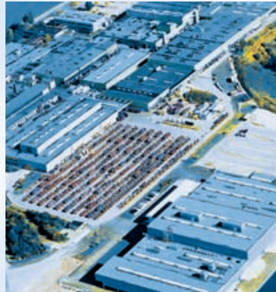
Hirschvogel Umformtechnik GmbH, Denklingen