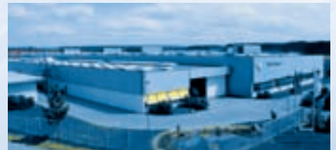
Hirschvogel Komponenten GmbH, Schongau