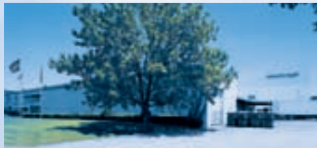
Hirschvogel Incorporated, Columbus/Ohio (USA)