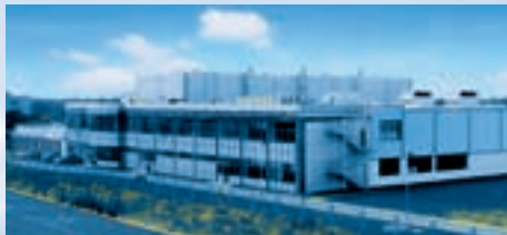
Hirschvogel Automotive Components, Pinghu (China)