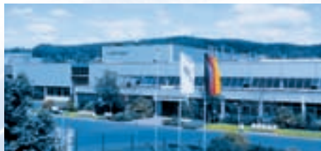
Hirschvogel Eisenach GmbH, Marksuhl